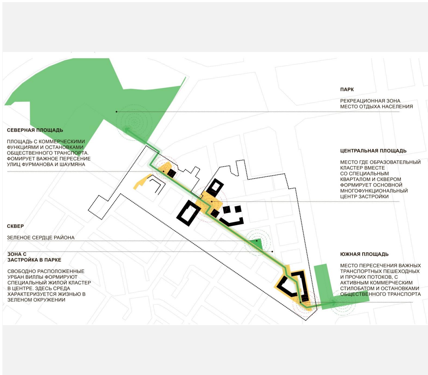
СХЕМА «КАРКАСА», ОСНОВНОЙ ПЕШЕХОДНОЙ СВЯЗИ