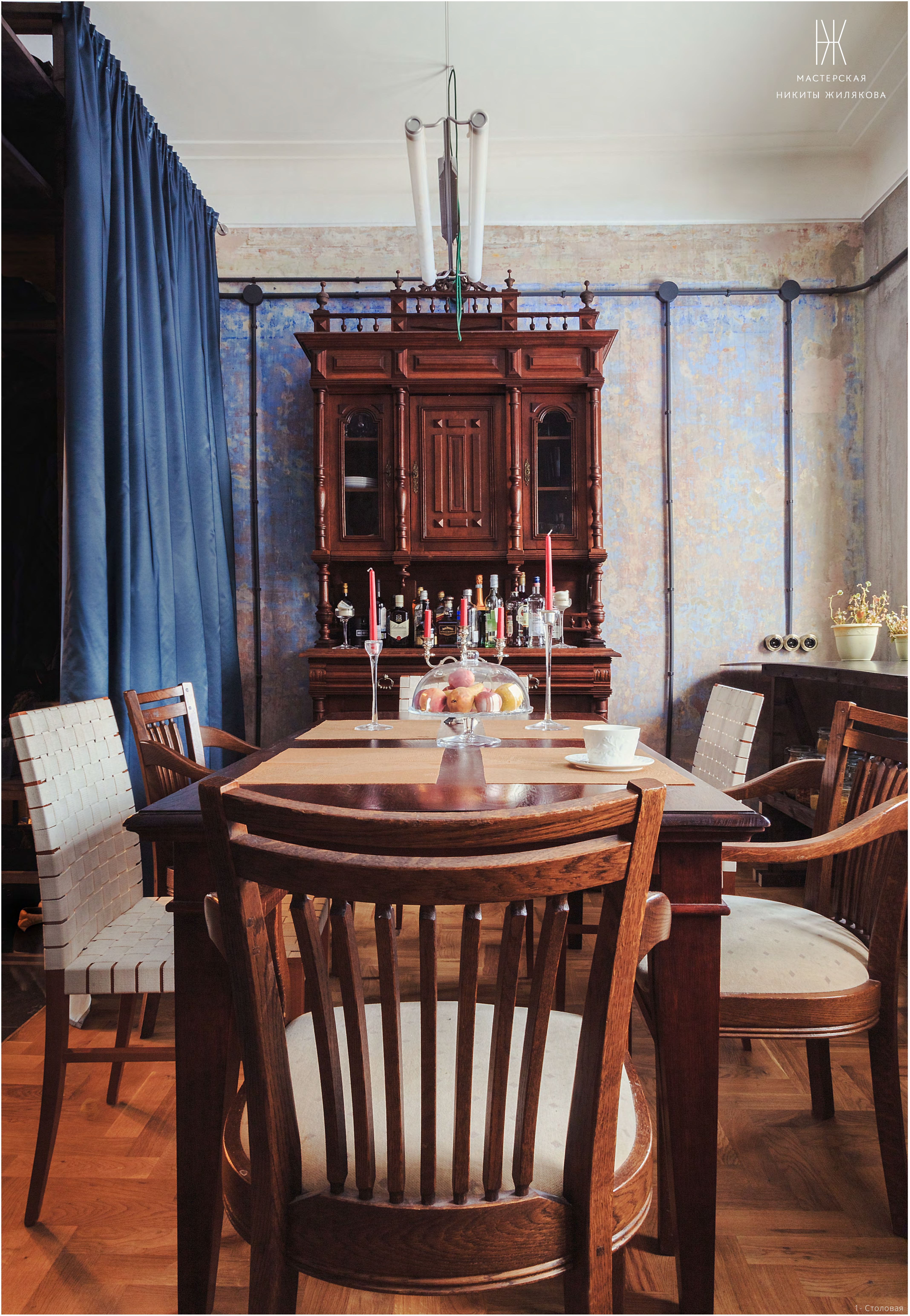
1 - Столовая