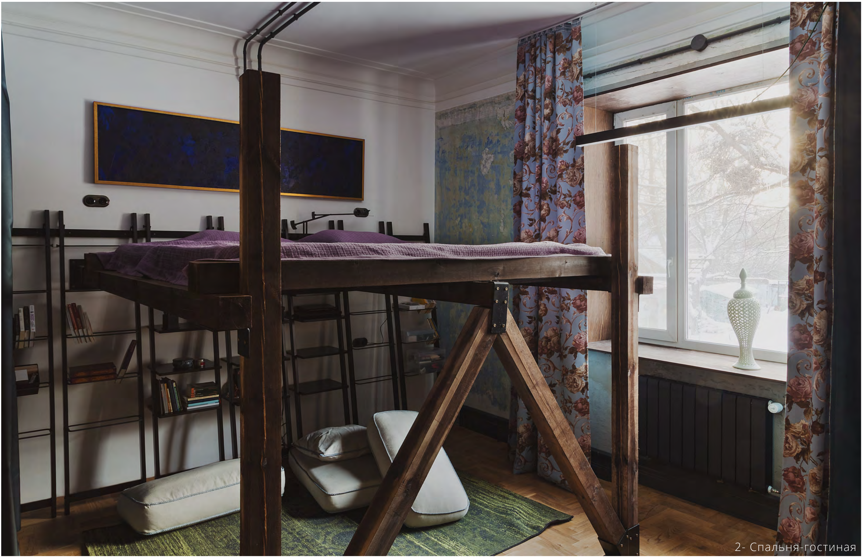
2 - Спальня-гостиная