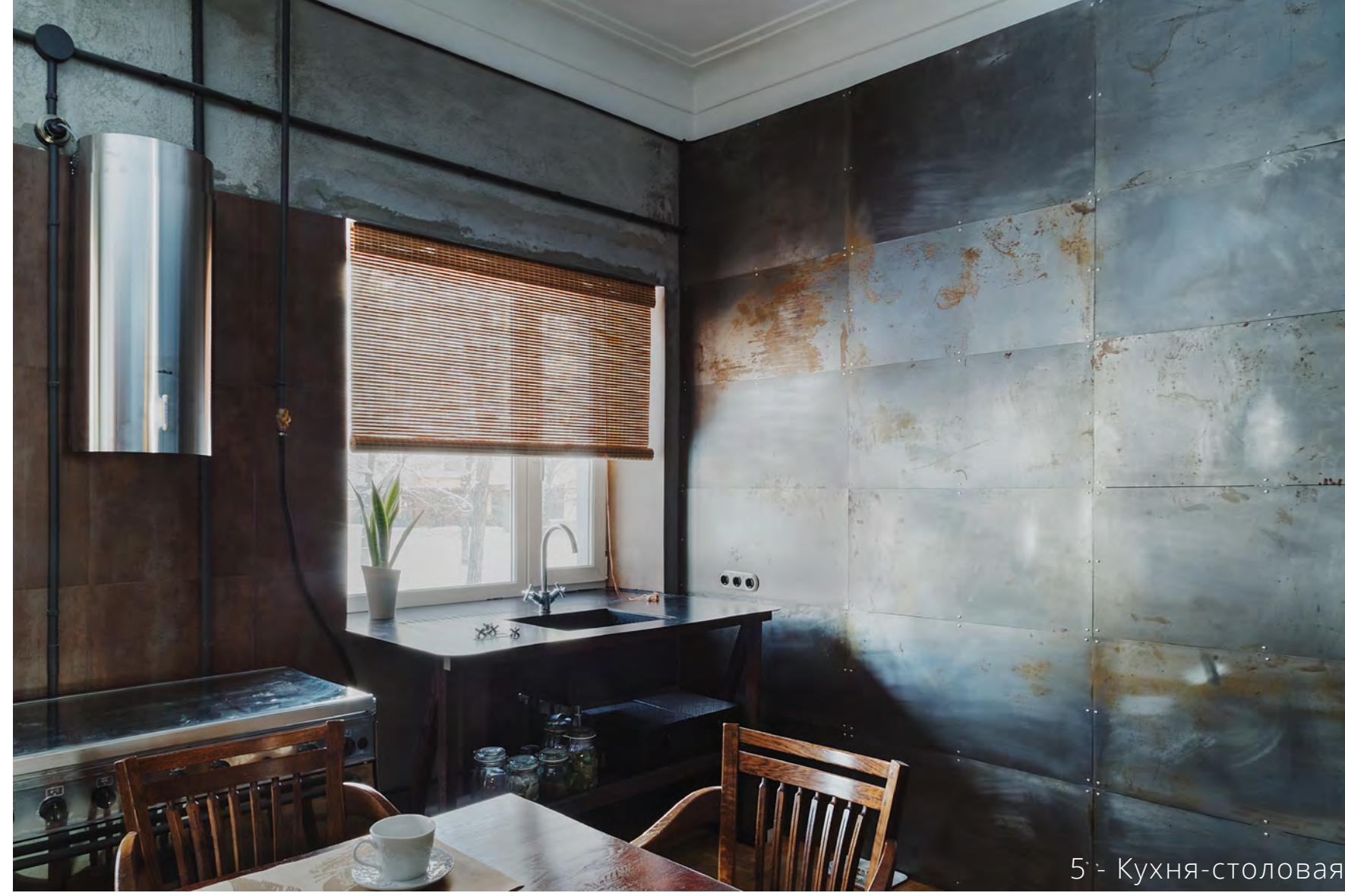
5 - Кухня-столовая