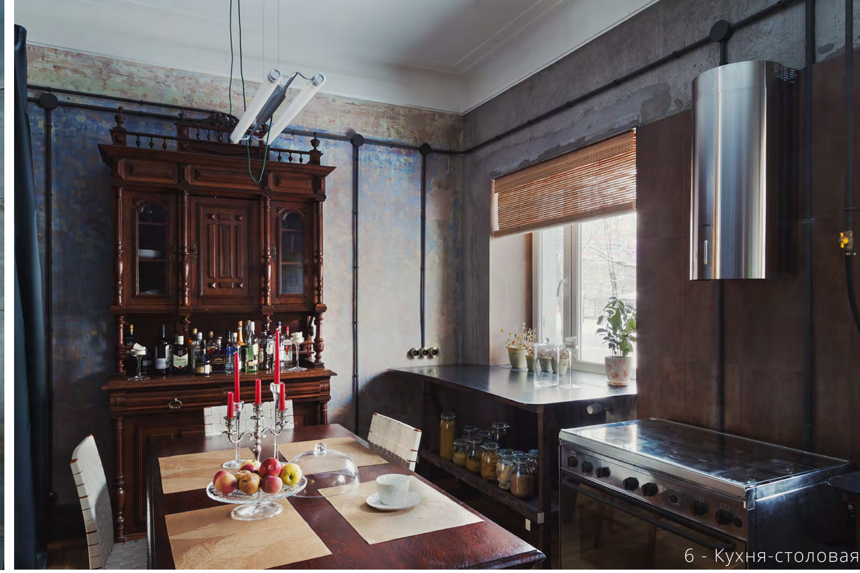
6 - Кухня-столовая