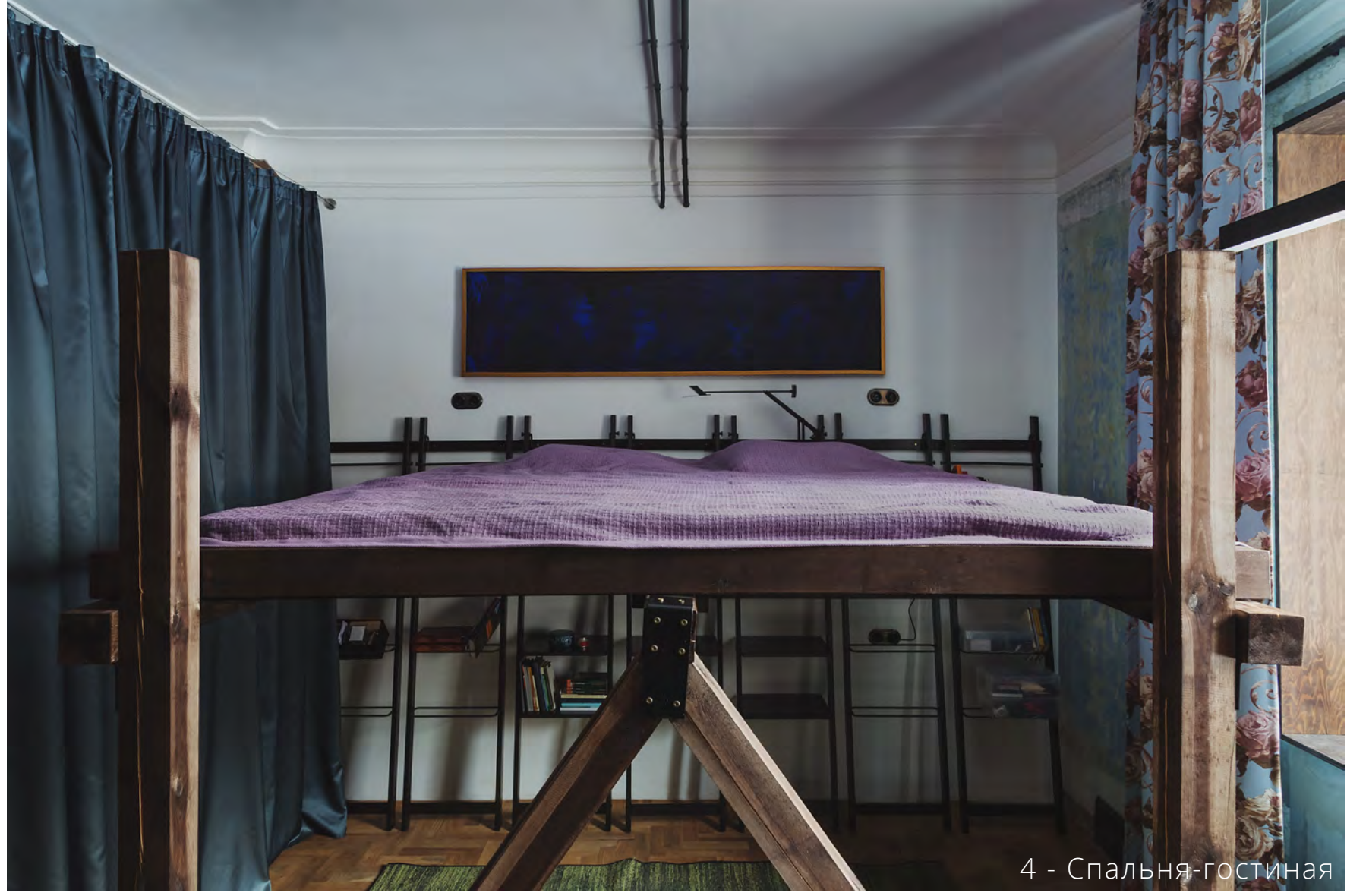
4 - Спальня-гостиная