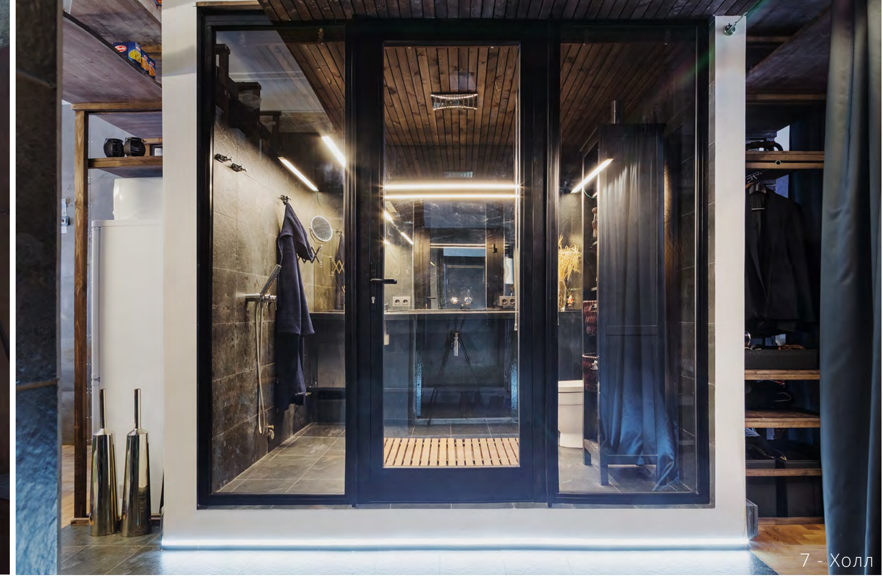
7 - Холл