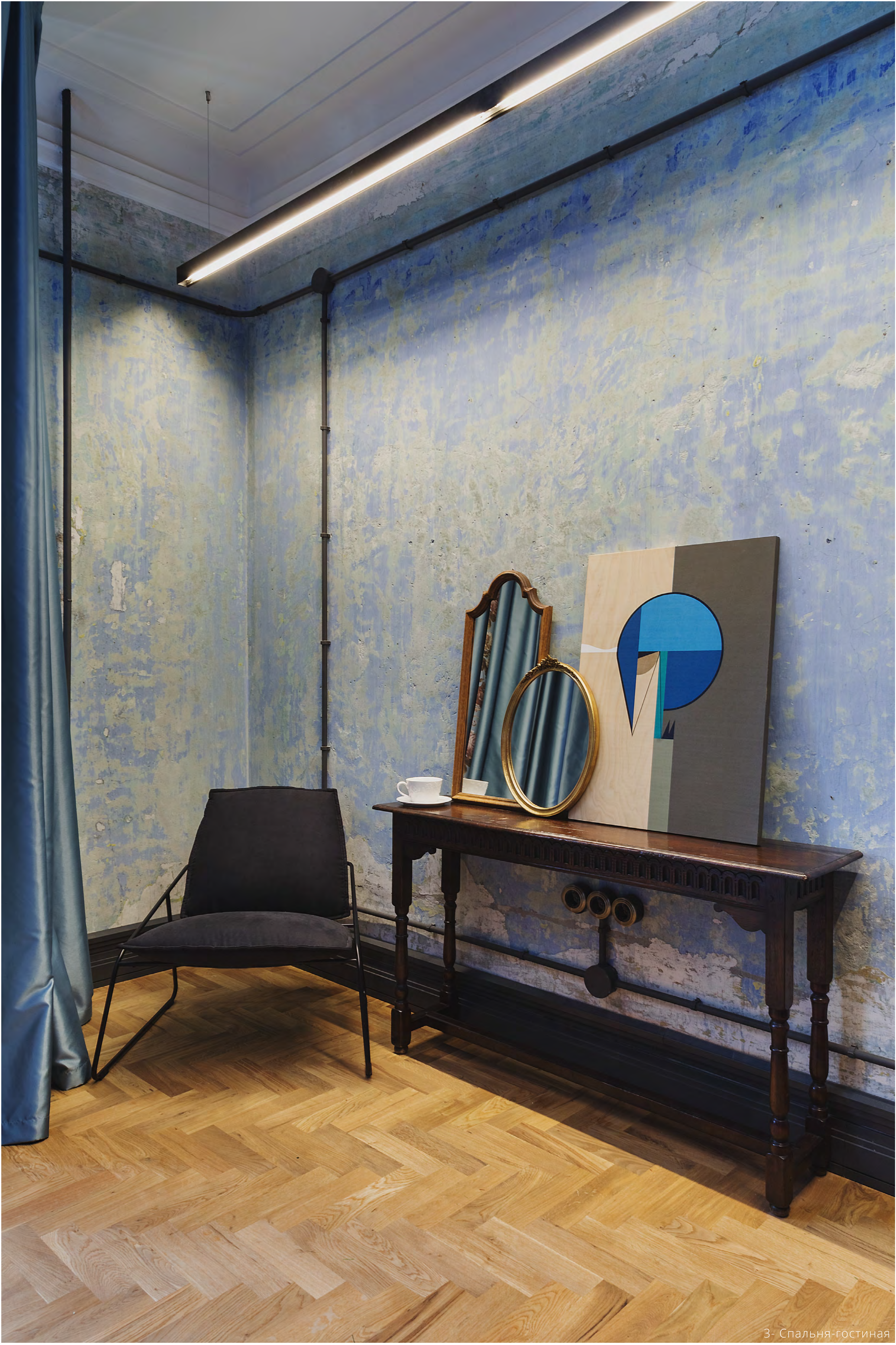
3 - Спальня-гостиная