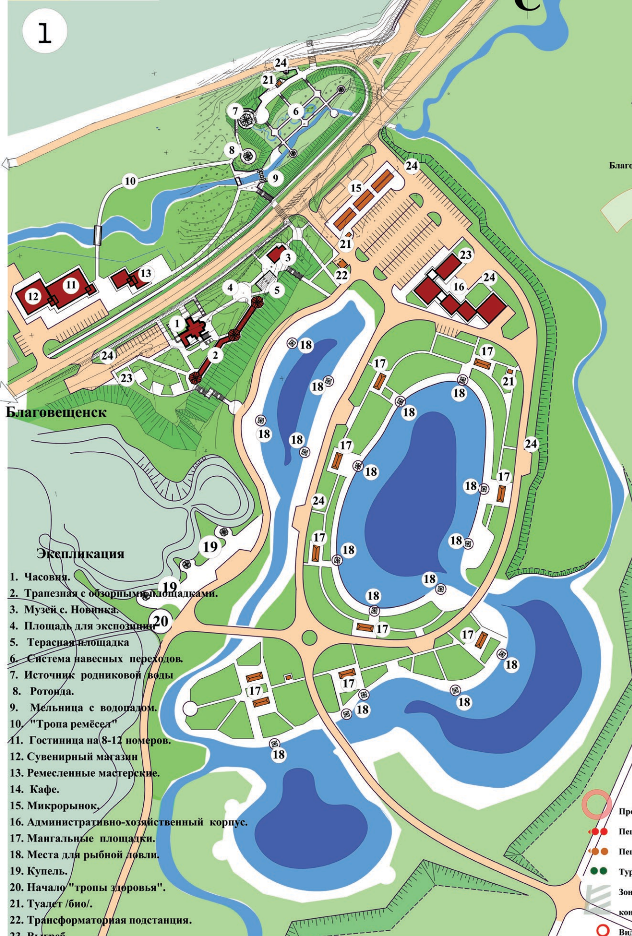
Схема функционального зонирования рекреационной зоны