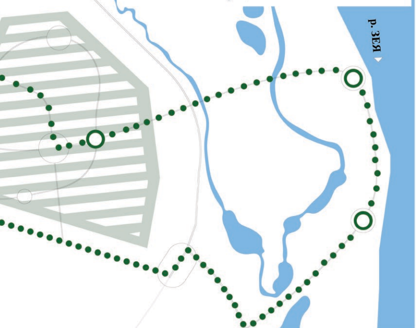
Схема размещения проектируемой рекреационной зоны в системе расселения ситуационный план