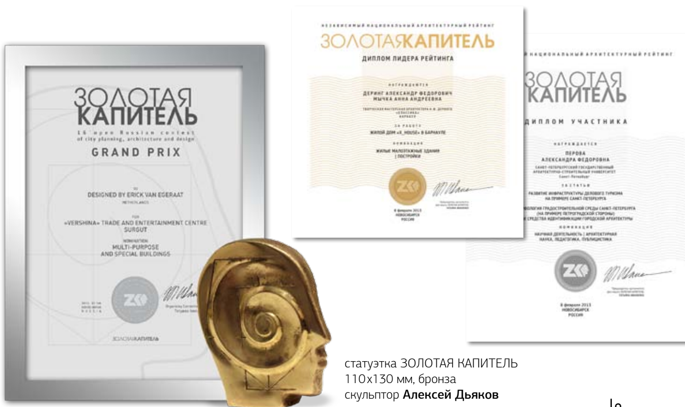
статуэтка ЗОЛОТАЯ КАПИТЕЛЬ 110x130 мм, бронза скульптор Алексей Дьяков

6.9. Организатор Рейтинга, партнеры, информационные партнеры и спонсоры фестиваля ЗОЛОТАЯ КАПИТЕЛЬ могут учредить специальные дипломы и призы и вручить их на официальной церемонии подведения итогов по согласованию с Оргкомитетом.