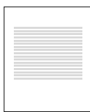
Заполненная заявка (регистрационная форма)

Вышлите заполненную Регистрационную форму и копию (скан) платежных документов на zk.festival@gmail.com (см. п. 7 и Приложение 2 или текстовый файл ZK2014_zajavka.doc )